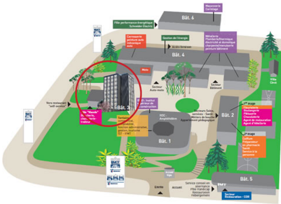
Diaporama de la tour d'hÃ©bergement